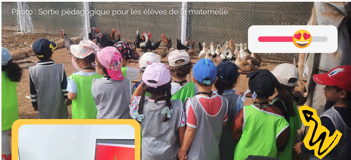
Photo : Sortie pédagogique pour les élèves de la maternelle