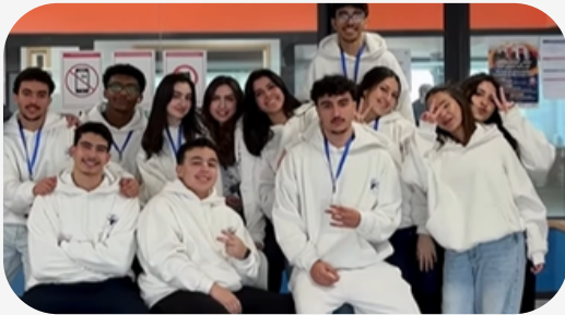
Les membres de l'association UNIACT

À travers l'association UNIACT, les élèves du CVL ont joué un rôle clé dans l'organisation du Marché de Ramadan, en participant à la préparation de l'événement et aux actions caritatives.